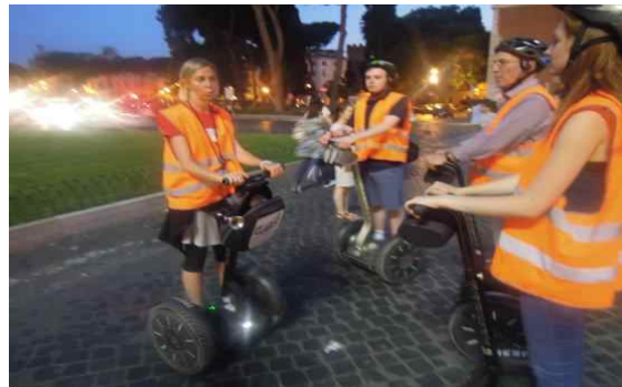
<야간 투어중인 관광객>