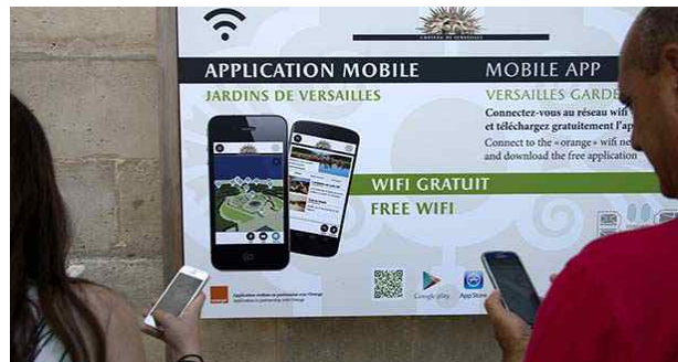
<와이파이 접속방법 안내>