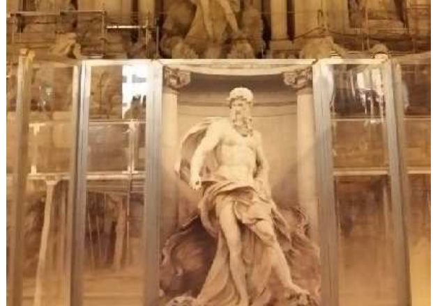
< 트레비분수 스크린 가림막 >