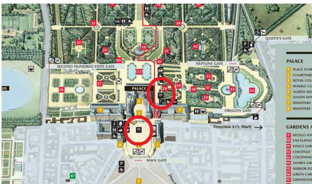
<와이파이 구역 표시>