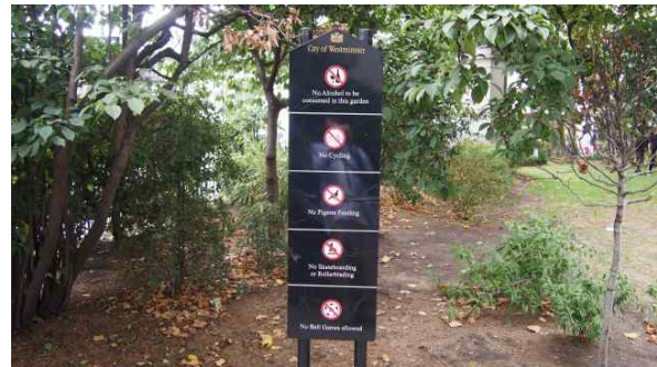
<공원내 금지 안내 간판>